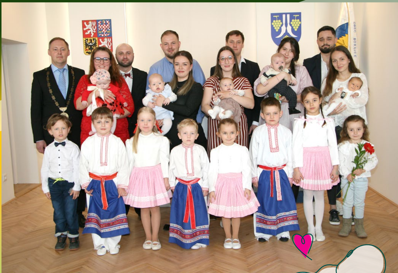
22. 03. 2025 – Vítání dětí do života