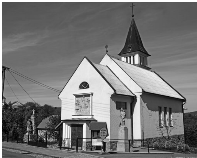
Kostel sv. Cyrila a Metoděje v Tučapech