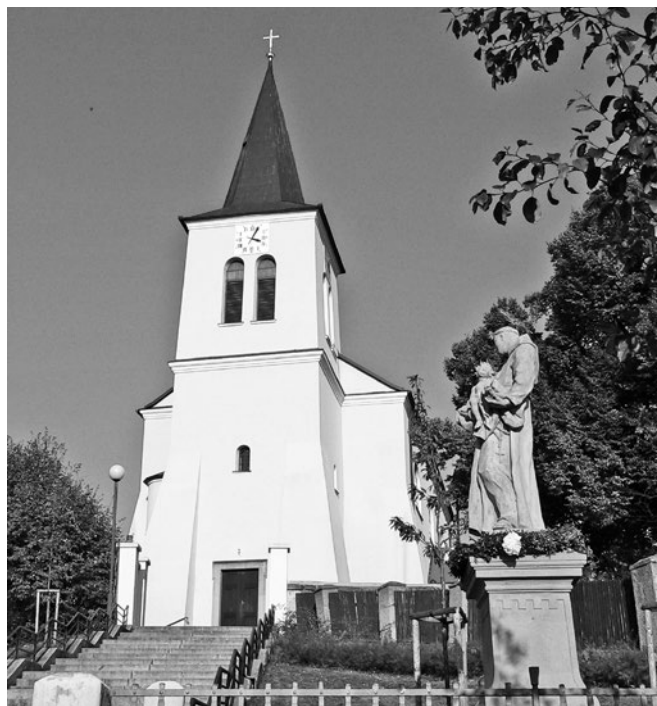
Kostel sv. Václava v Boršicích