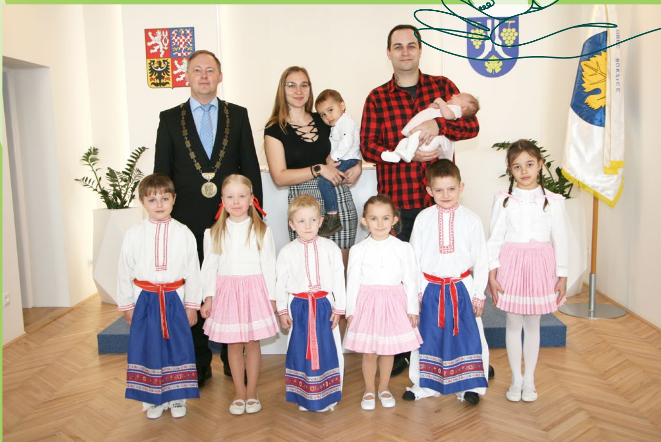
22. 03. 2025 - Vítání 1. občánka do života