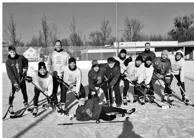
zimní soustředění A-mužstva